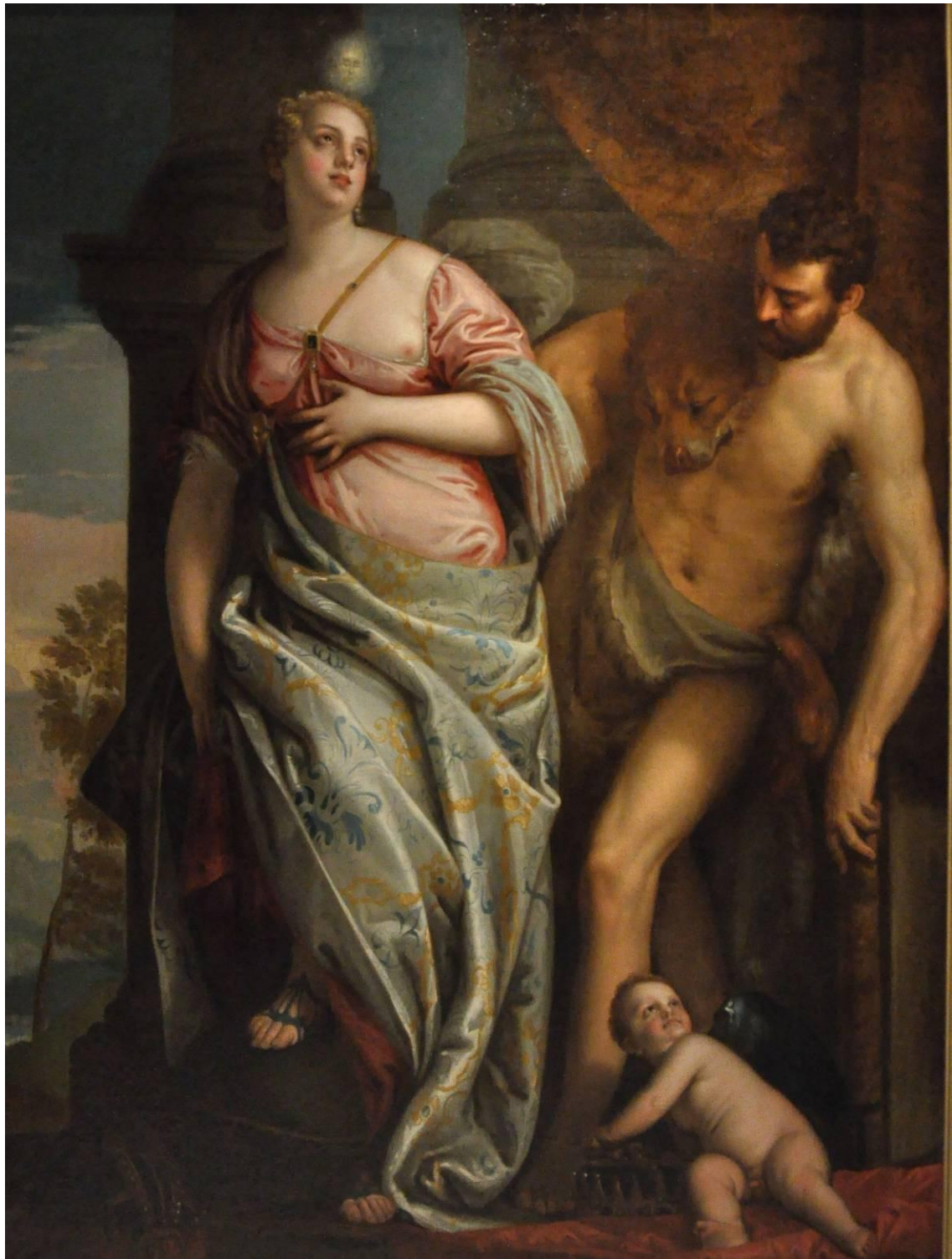
Άγνωστος, Αλληγορία της Σοφίας και της Δύναμης 18 ος αι., λάδι σε μουσαμά, Εθνική Πινακοθήκη Αθηνών, Κληροδότημα Γεωργίου Αβέρωφ . Το έργο αποτελεί αντίγραφο του έργου του Paolo Veronese (1528 Βερόνα-1588 μ.Χ. Βενετία) που εκτίθεται σήμερα στο Μουσείο Frick Collection της Νέας Υόρκης.